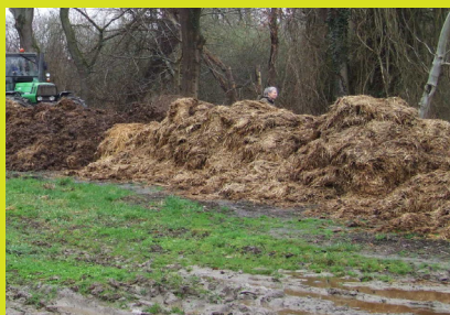
Compostage - Fumier de vache

De plus, lors de son intégration au sol, les micro-organismes chargés de le décomposer auront besoin de beaucoup plus d'azote, qu'ils puiseront dans les réserves du sol , au détriment des légumes (faim d'azote).