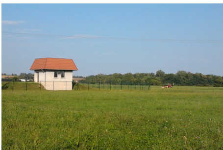
Prairies du champ captant de Mommenheim permettant de protéger les captages d'eau potable

Et le colibri lui répondit : «Je le sais, mais je fais ma part.»